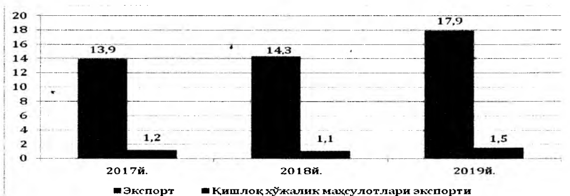
1-расм. Ўзбекистон Республикасида экспорт ва қишлоқ хўжалик маҳсулотлари экспортининг ҳажми, млрд. АҚШ доллари [9]

- экспорт қилувчи юридик шахслар мева-сабзавот маҳсулотлари экспортини дастлабки тўловсиз, аккредитив очмасдан, банк кафолатини расмийлаштирмасдан ҳамда экспорт шартномани тижорат ҳавфларидан сугурта полисисиз амалга ошириш ҳуқуқига эга;